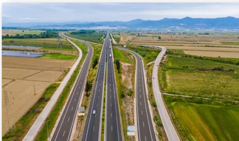
Νότιο Τμήμα Λαμία - Ξυνιάδα