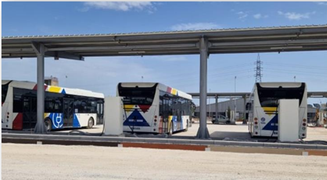
Σταθμός Φόρτισης ΟΑΣΘ